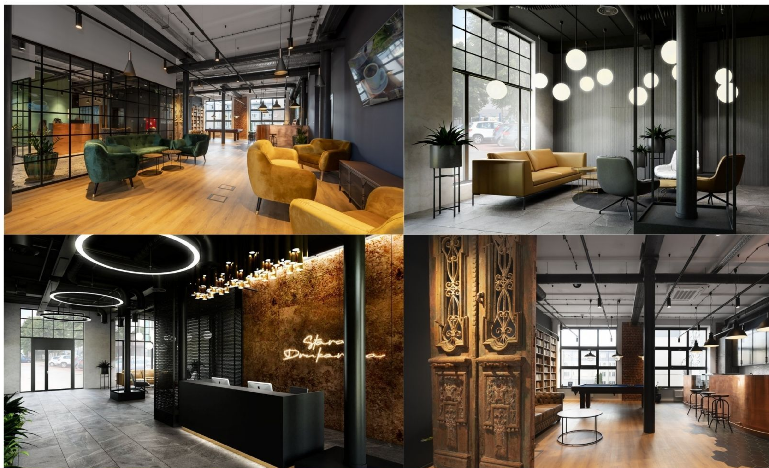
STARA DRUKARNIA, GDAŃSKA 130