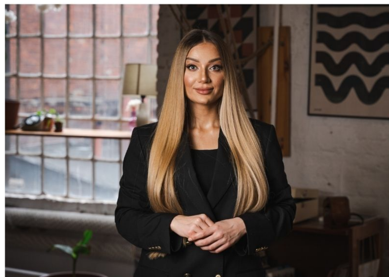
ZDJĘCIE W PRZESTRZENI