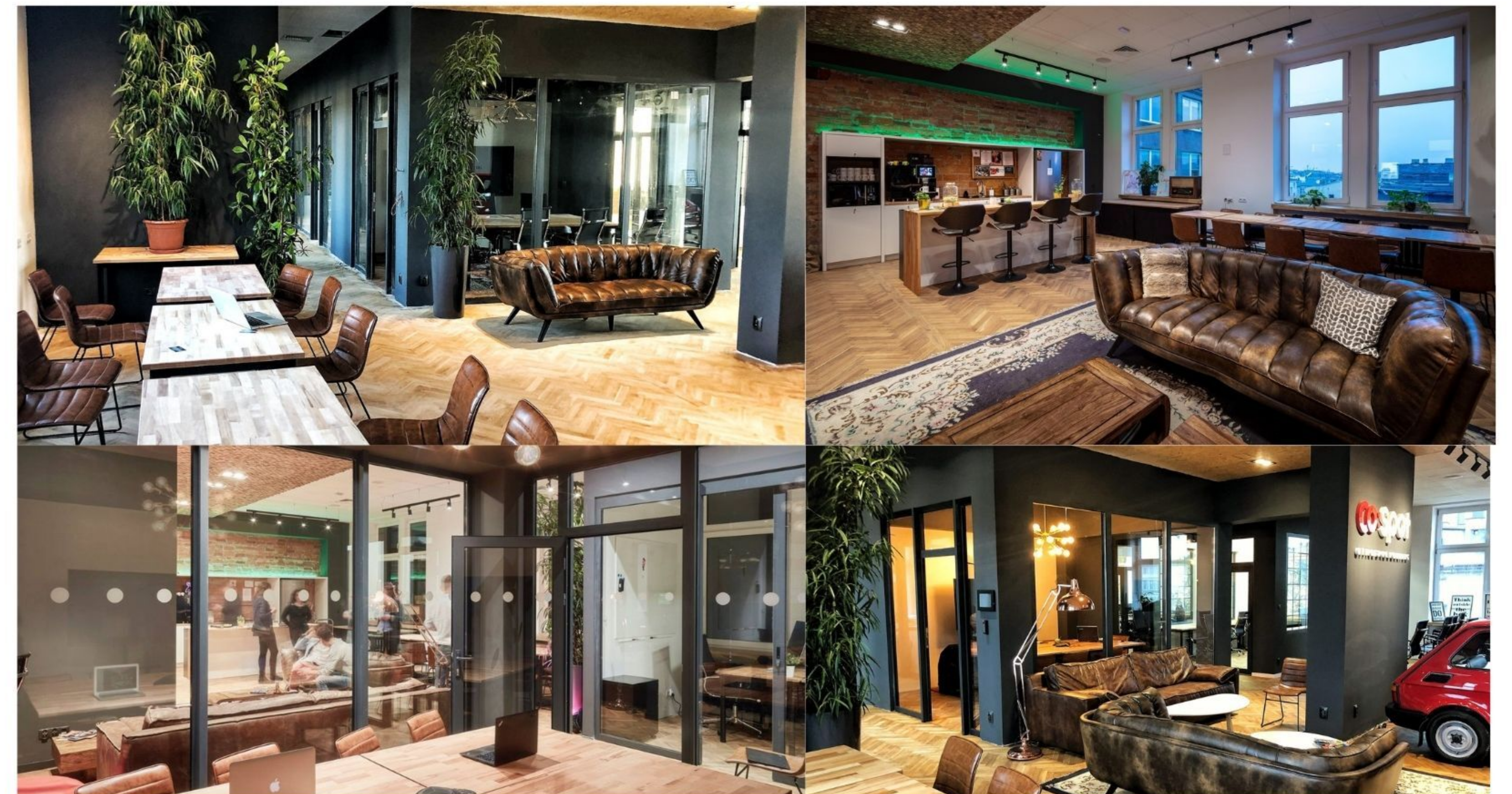
CO SPOT, ZACHODNIA 70