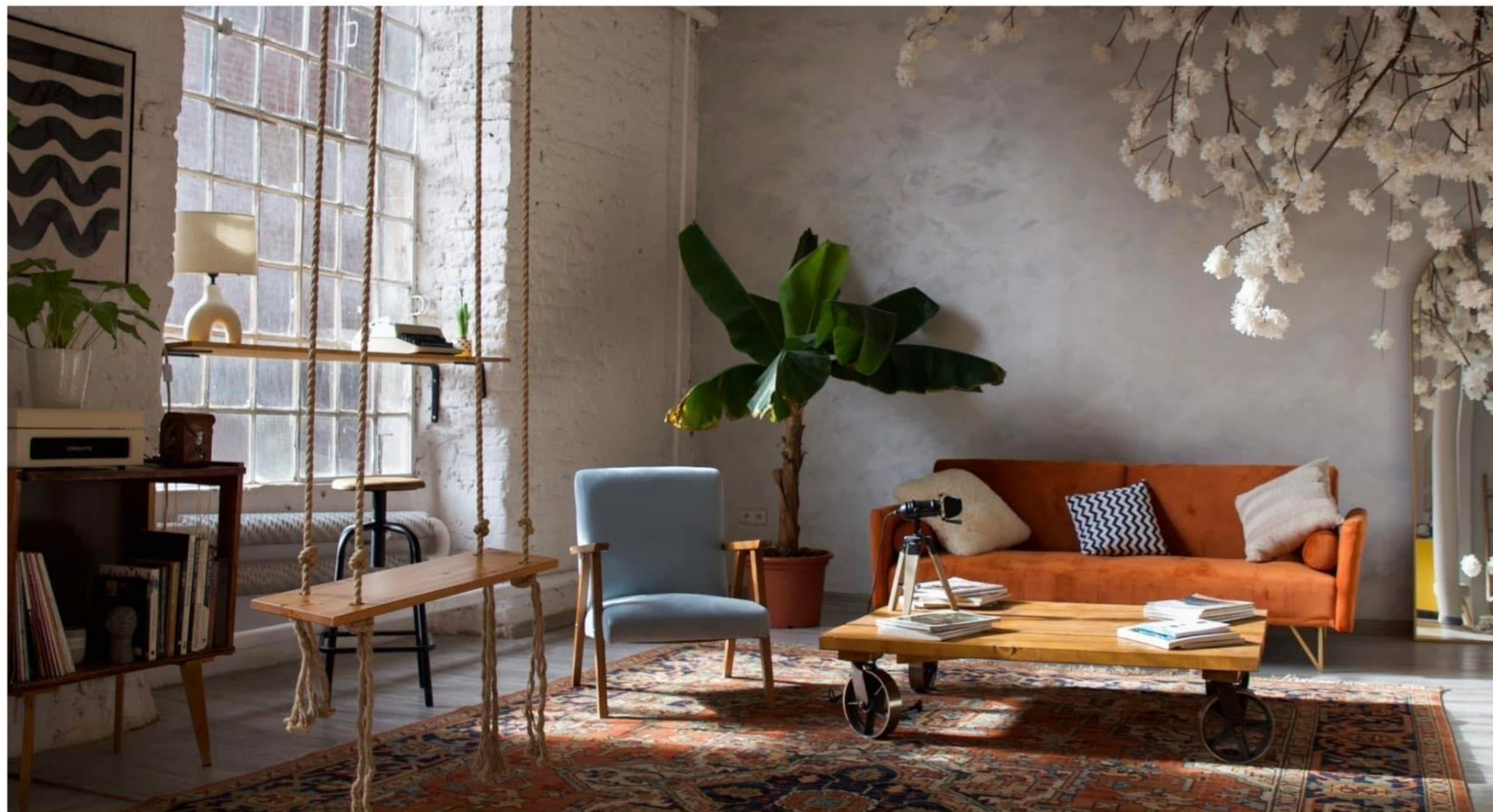
LOFFT STUDIO , OFF PIOTRKOWSKA CENTRE

Przykładowe przestrzenie biurowe, aranżowane studia fotograficzne, zdjęcia u klienta w firmie.